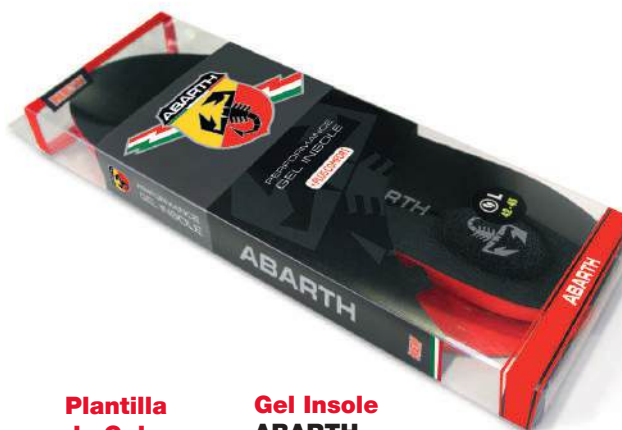
Plantilla de Gel ABARTH +PLUS COMFORT

Tallas 36-41: Ref.ABAC001-36 Tallas 42-47: Ref.ABAC001-42