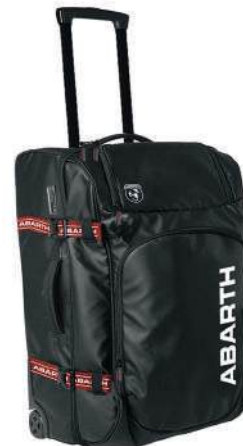
TROLLEY Negro poliester