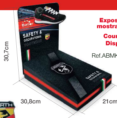
Expositor mostrador Counter Display