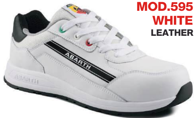
MOD.595 WHITE LEATHER