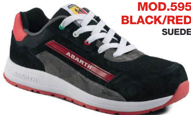
MOD.595 BLACK/RED SUEDE