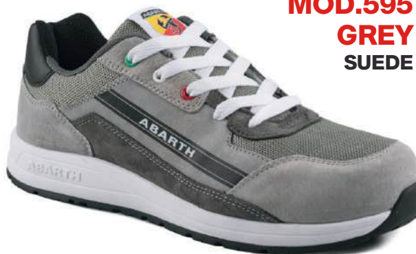
MOD.595 GREY SUEDE