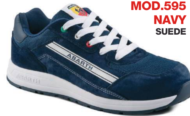
MOD.595 NAVY SUEDE