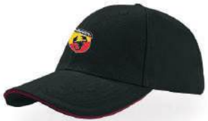
Gorra Promocional Promotional Cap