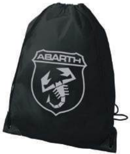
Bolsa promocional Abarth