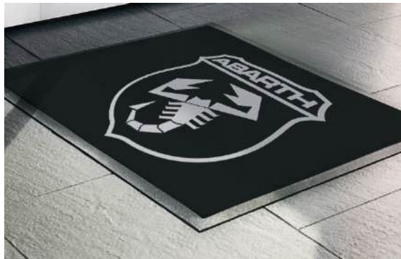
Alfombra Promocional Promotional Carpet