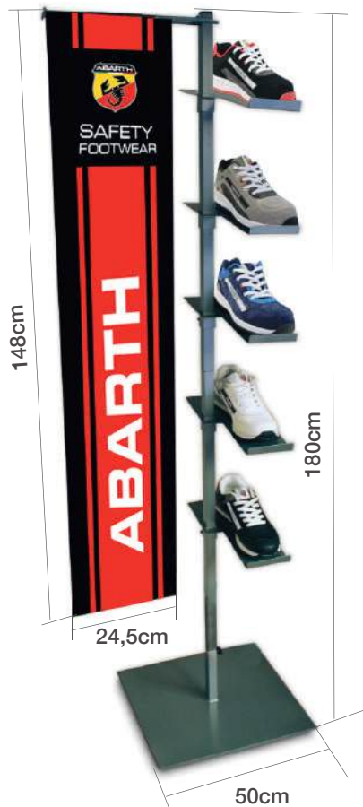
Ref.ABMK013 Bandera Abarth Abarth safety Flag Ref.ABMK014 Torre expositor 6 posiciones (sin bandera) Tower display 6 positions (without flag)