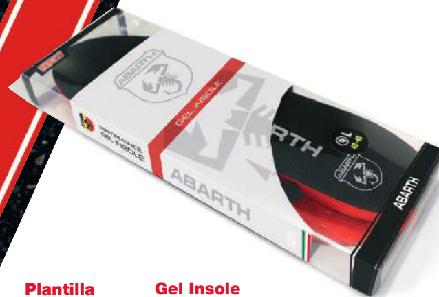
Plantilla de Gel ABARTH Performance