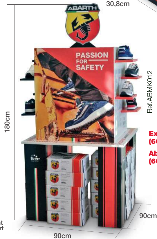
Expositor grande Abarth (60 zapatos) Abarth big display stand (60 shoes)