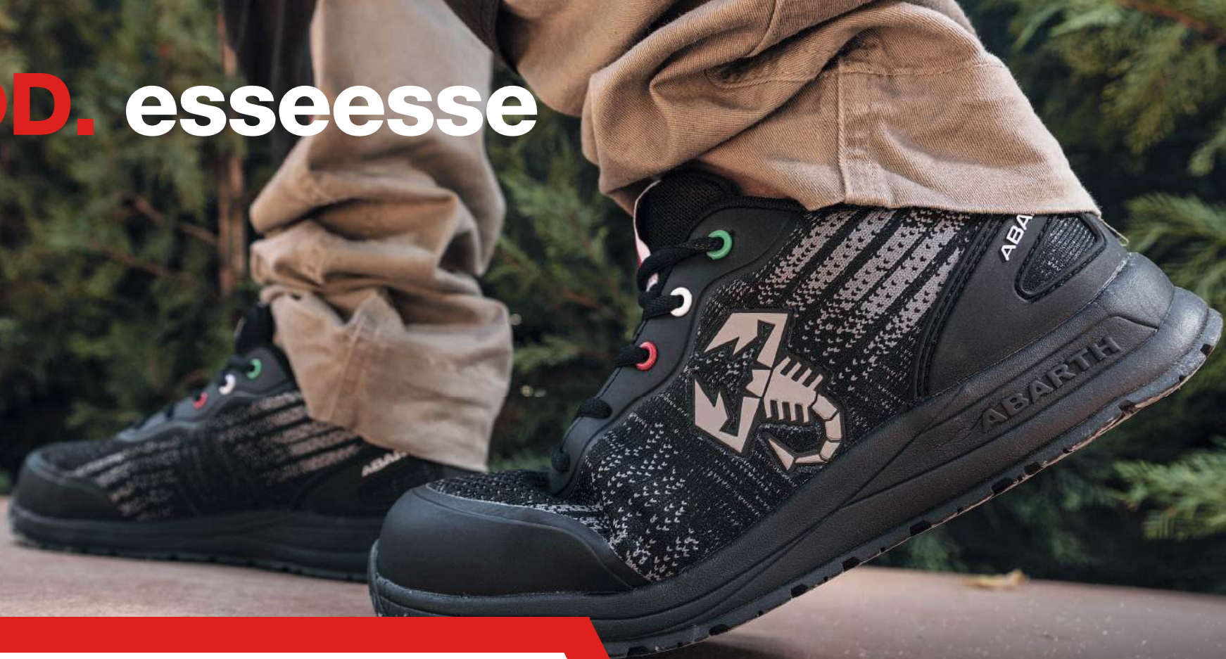
MOD. esseesse BLACK