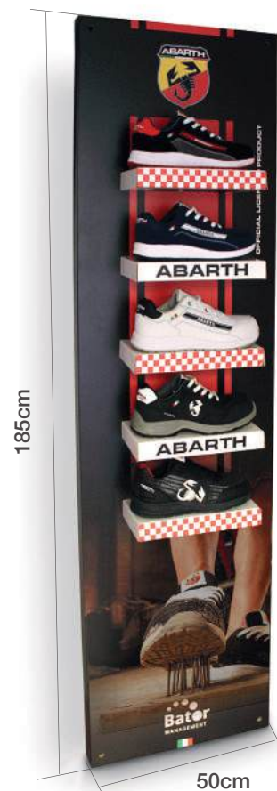
Expositor pared Abarth 5 posiciones Abarth shoes wall display 5 positions 3 posibilidades magnetico, colgante o soporte madera 3 possibilities magnetic, pendant or wooden support