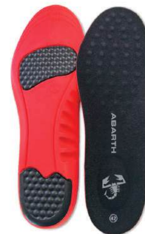
Gel Insole ABARTH +PLUS COMFORT

Tallas 36-39: Ref.ABAC002-36 Tallas 39-42: Ref.ABAC002-39 Tallas 42-45: Ref.ABAC002-42