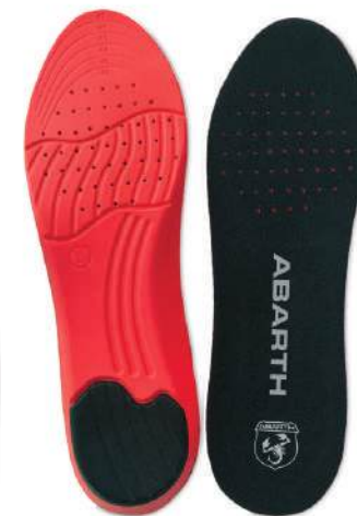
Gel Insole ABARTH Performance

Tallas 36-41: Ref.ABAC001-36 Tallas 42-47: Ref.ABAC001-42