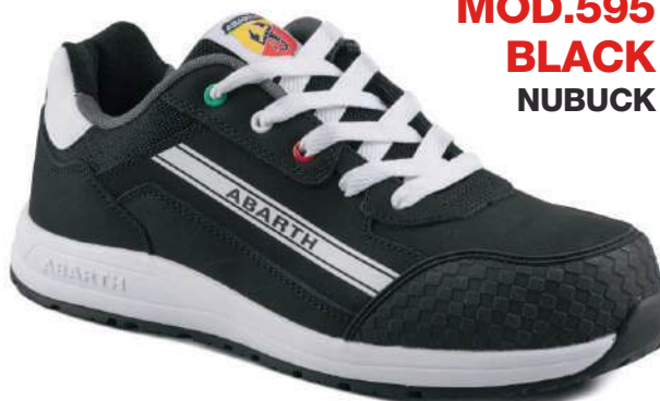
MOD.595 BLACK NUBUCK